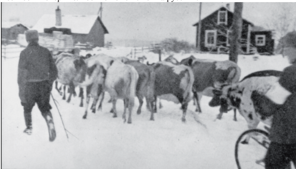
С началом зимней войны жителей и скот эвакуировали в западную Финляндию.

9.6.1944 года советские войска начали мощное наступление на перешейке. Войска продвигались быстро, и уже через две недели были в Выборге. За Выборгом финские войска смогли остановить советское наступление в июне-июле 1944 года. СССР отказалось от требований полной сдачи Финляндии, и договор о сложении оружия был заключен 4.9.1944 года, а промежуточный мирный договор в Москве 19.9.1944 года, В Парижском мирном договоре в 1947 границу вернули на основании границы 1940 года. Карелы потеряли родные места во второй раз. Жители местности теперь полностью поменялись на русских.